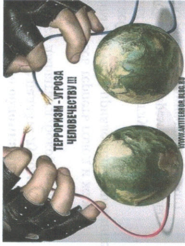
Терроризм - угроза человечеству III